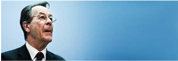
Mann mit Visionen: SPD-Chef Franz Müntefering.

Entgegen des Rates des Genossen Helmut Schmidt hat SPD-Chef Müntefering Visionen: 20 Jahre nach dem Mauerfall träumt er von einer deutschen Verfassung.