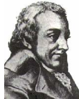
Johann Gottlieb Fichte

„Fast durch alle Länder von Europa verbreitet sich ein mächtiger feindselig gesinnter Staat, der mit allen übrigen im beständigen Krieg steht, und der in manchem fürchterlich schwer die Bürger drückt: es ist das Judentum. - - - Menschenrechte müssen sie haben, ob sie gleich dieselben uns nicht zugestehen; denn sie sind Menschen und ihre Ungerechtigkeit berechtigt uns nicht, ihnen gleich zu werden. - - -